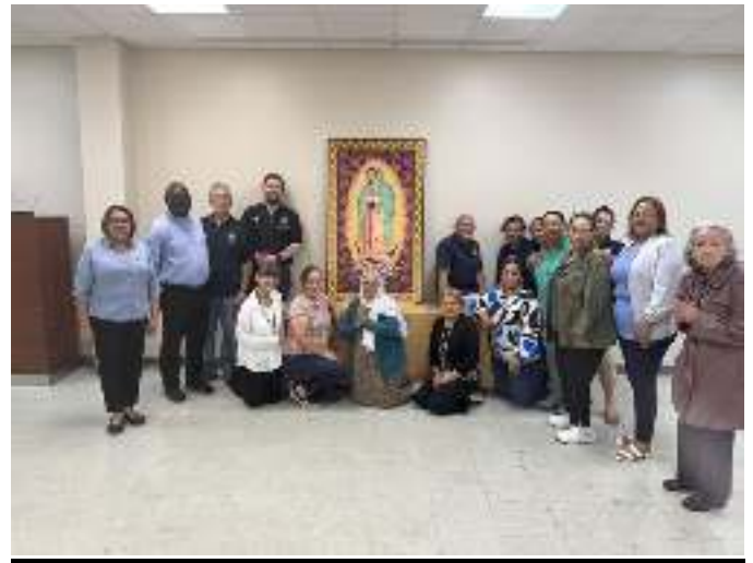
IMAGEN DE NUESTRA SEÑORA DE GUADALUPE